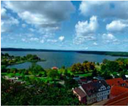
Blick auf den Sternberger See