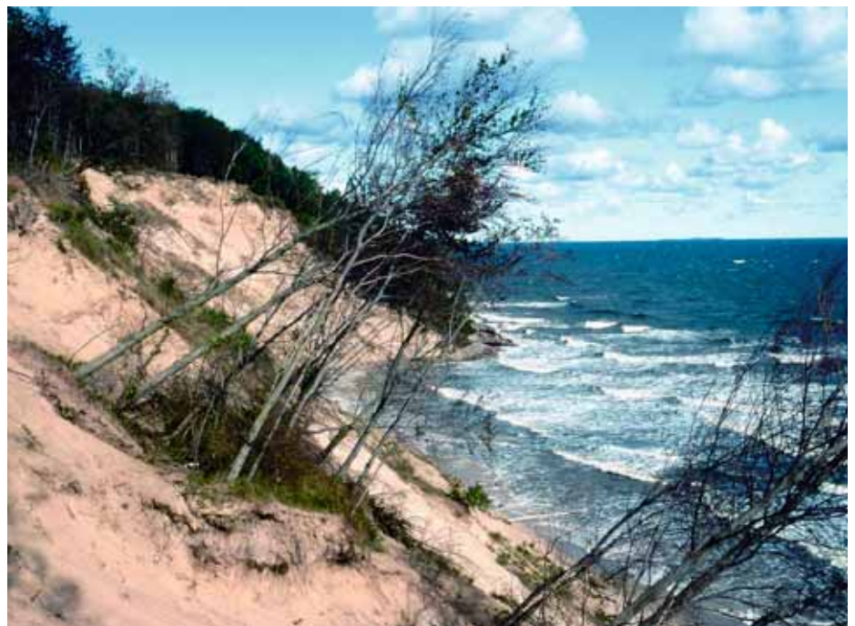
Steilküste am Streckelsberg